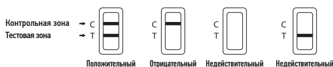
Положительный Отрицательный Недействительный Недействительный

Если цветная полоска не появилась в контрольной зоне (C), или полоска появилась только в зоне (T), а в зоне (C) ее нет, тест считается недействительным. Повторите процедуру, используя новый тестовый комплект. Если результат повторного теста недействителен, свяжитесь с распространителем и укажите номер партии.